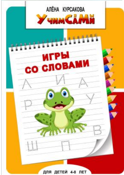
Наглядный раздаточный материал